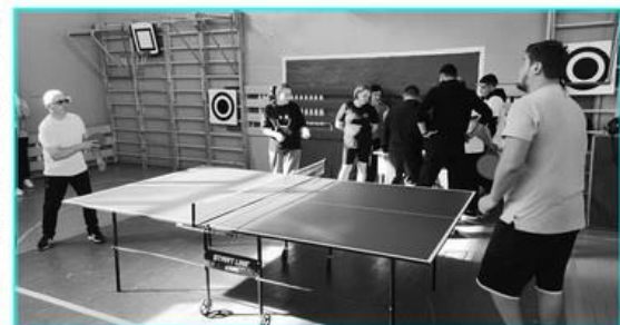
«АҚ БИДАЙ - 2025» ОБЛЫСТЫҚ ЖАЗҒЫ СПОРТ МЕРЕКЕСІ