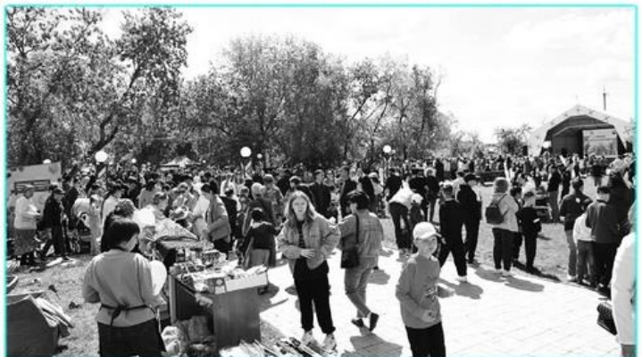
MIDDLES», «LEGION PRO» би топтары қатысты. Сондай-ақ мерекеде «Ғажайыптар мен «ХАНШАЙЫМ» үлгілі би ұжымы елінде» агенттігінің аниматорлары барлық

Жаз - әлемдегі барлық балалар үшін ең сүйікті уақыт екені сөзсіз. Бұл кезеңге көңілді демалыс, табиғатқа серуендеу, өзенге шомылу және көптеген түрлі іс-шаралар мен шытырман оқиғалар кіреді. Бір сөзбен айтқанда - балалар барынша демалады. Жаздың алғашқы күні - Халықаралық балаларды қорғау күні атал өтіледі. Осыған орай, аудандық білім бөлімі Булаев қаласының «Достық» демалыс саябағында «Балалық шақ - кішкентай ғалам» атты мерекелік үлкен іс-шара ұйымдастырды.