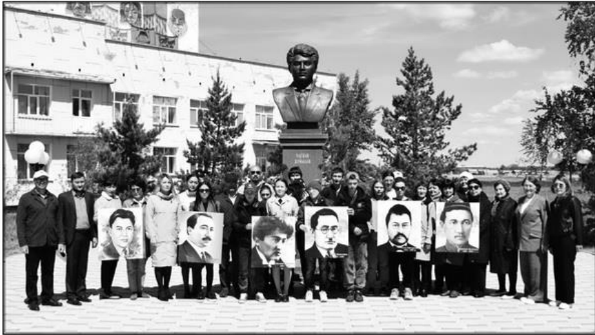
ЗАҢ ЖӘНЕ ҚОҒАМ