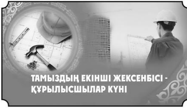
ТАМЫЗДЫҢ ЕКІНШІ ЖЕКСЕНБІСІ - ҚҰРЫЛЫСШЫЛАР КҮНІ

Әр мамандықтың қегенде алатын өзіндік сұны, мәртебесі бар. Сондай мәртебелі мамандықтардың бірі - құрылысшы мамандығы. Қазақстан Республикасының Президенті тамыз айының екінші жексенбісін «Қазақстан құрылысшылары күні» деп жариялаған бастауын.