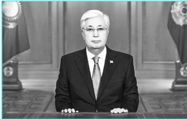
соңғы он жылдағы рекордтық көрсеткішке айрықша атап өткен жөн. қол жеткізген диқандарымыздың жетістігін Мен былтырғы сұхбатымда 2024 жыл

– Былтыр көптеген маңызды оқиға болды, қыруар жұмыс атқарылды. Мысалы, әбден тозығы жеткен инженерлік-коммуналдық инфрақұрылымды жаңғырту жұмыстары барлық аймақта жүргізілді. 18 миллион шаршы метр тұрғын үй пайдалануға берілді. 7 мың шақырым автокөлік жолы салынып, жөндеді. Алматы, Қызылорда және Шымкент әуежайларында жаңа жолаушылар терминалы іске қосылды. Тау-көк, мұнай-химия және металлургия салаларында ауқымды жобалар жүзеге асырылды. Қайта өңдеу секторы қарқынды дами бастады. Оның өнеркәсіптегі үлесі өндіру саласының деңгейіне жуықтады. 27 миллион тоннаға жуық астық жинап,