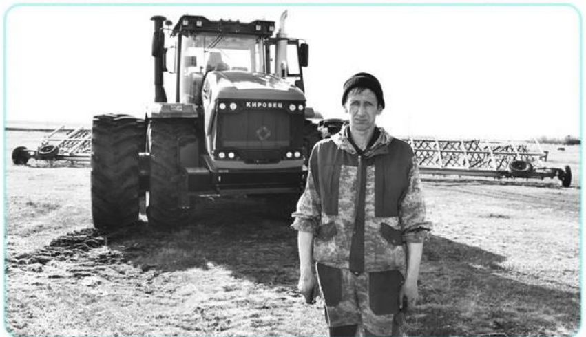
Күн жылынып, жер жібіген соң, аудан диқандары көктемгі егіс жұмыстарына кіріспек. Ал қазір агроқұрылымдар ауыл шаруашылығы техникаларын сақдай сайлап, дән себу үшін барлық қажетті шаралар қабылдауда. Оған Үкімет те үлкен көңіл бөліп, барлық қолдайы жасап отыр. Мәселен, Мемлекет басшысының 2025 жылғы көктемгі егіс және егін жинау жұмыстарын ерте қаржыландыру жөніндегі тапсырмасына сөйкес жеңілдетілген кредит беруге өтінімдерді қабылдау 2024 жылғы 29 қарашада басталды. Бұл шаралар фермерлерге барлық қажетті шараларды сапалы өткізуге, тұқымдар, тыңайтқыштар сатып алуға және техниканы дайындауға мүмкіндік беру үшін қабылданды.