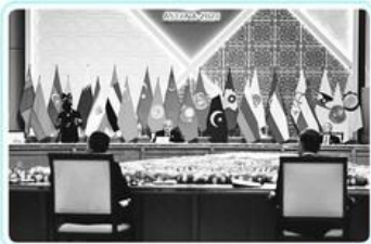
была принята инициатива ШОС «О мировом единстве за справедливый мир, согласие и развитие».

В Астане завершилось заседание Совета глав государств - членом ШОС. По его итогам представители стран-участников подписали ряд ключевых документов, среди которых Астанинская декларация Совета глав государств - членом ШОС, передает корреспондент Tengrinews.kz. В принятом документе говорится о необходимости повышать роль ШОС в формировании условий для укрепления всеобщего мира, безопасности и стабильности, а также построения нового демократического, справедливого политического и экономического международного порядка. С этой целью