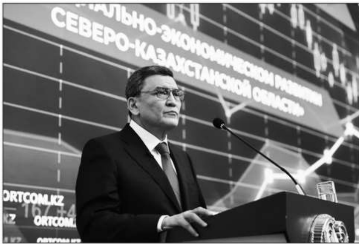
Биылғы көктем Солтүстік Қазақстан облысына оңайға соқпады. Өңір инфрақұрылымына су тасқынынан үлкен залал келді. Облыс аумағындағы 4 мыңға жуық үйді су басты. Оның тең жартысы – Петропавлдағы үйлер. Су тасқынынан зардап шеккендерге мемлекет тарапынан барлық қажетті көмек пен қолдау көрсетілді. Орталық коммуникациялар қызметіндегі баспасөз жиынында Солтүстік Қазақстан облысының әкімі Fayez Nurmukhambetov өңірдің даму көрсеткіштеріне тоқталды.

Өңірде ет өндіру саласы табысты дамып келеді. Құс етінің импорттық тәуелділігін алмастыру мақсатымен облыста қуаттылығы жылына 6,5 мың тонна болатын 2 құс еті фабрикасы салынды. Шошқа фермасын 100-ден 200 мың басқа дейін кеңейту жалғасып жатыр. Жоба