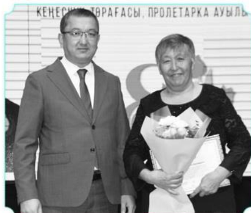
КЕҢЕСШІ ТӨРАФАСЫ, ПРОЛЕТАРКА АУЫЛЫ