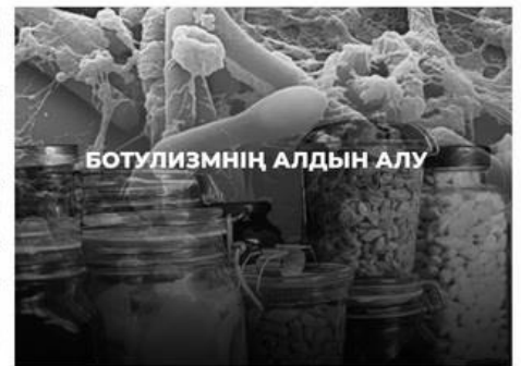
БОТУЛИЗМНІҢ АЛДЫН АЛУ

шатастыру жағдайлары жиі кездеседі. Егер науқасқа уақтылы дәрігерлік көмек көрсетілмесе, организмнің токсиннен ұлануы салдарынан аз уақытта өлімге алып келеді. Сондықтан айтылған талаптарды орындап сатып алатын тағамдарыңызға сақтықпен қарағаныңыз жөн.