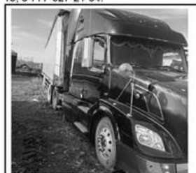
Фуру "Американец", г. Булаево. Тел. 8-777-417-77-45.

АВТОТРАНСПОРТ ♦ КамАЗ-55102 (колхозник), К-700, Т-150К, ДТ-75 (две единицы), двигатели ЯМЗ-236, СМД-20, ГАЗ-4301, селки СЗС-2.1, КПГ-5, КПЗ-3.8, плуги 3, 4 (корпус), ЛДГ-10, прицепы и полуприцепы, стогомет СЩР, зернопогрузчик ленточный. Тел. 5-19-94, 8-705-211-38-13, 8-777-927-21-54.