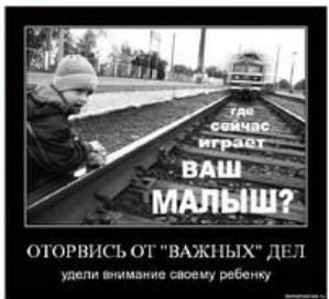
ОТОРВИСЬ ОТ "ВАЖНЫХ" ДЕЛ удели внимание своему ребенку

его остановки. • Не заходите за линию безопасности у края пассажирской платформы. • Не повреждайте оборудование железнодорожного транспорта. • Не приближайтесь к оборванным проводам.