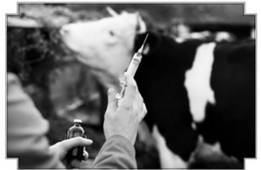
Құрметті Мағжан Жұмабаев ауданының тұрғындары!

АУДАНДА ВЕТЕРИНАРИЯЛЫҚ – ПРОФИЛАКТИКАЛЫҚ ІС-ШАРАЛАР ЖҮРГІЗІЛУДЕ