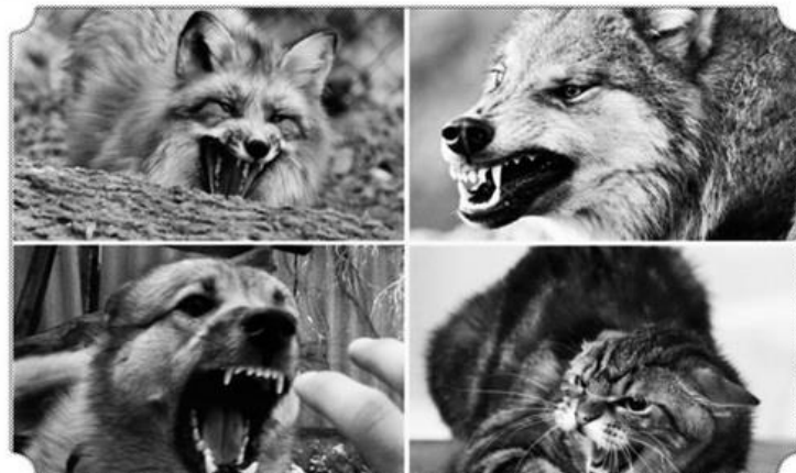
Құтырудың алдын алу:

Құтыру — вирус арқылы таралатын қауіпті ауру. Ол жануарлар мен адамдарға ауру жұқтырған жануар тістегенде, тырнағанда немесе сілекейі зақымдалған тері мен шыршыты қабықтарға түскенде беріледі. Вирустың негізгі тасымалдаушылары — жабайы жануарлар (түлкілер, қасқырлар, жанат тәрізді иттер) және жарқанаттар. Олардан ауру үй жануарларына және адамдарға жұғуы мүмкін. Сондай-ақ, бұл ауру ірі қара мал, жылқы және басқа да шөпкөректі жануарлар арасында тіркеледі. Жануарлардағы инкубациялық (жасырын) кезең алғашқы белгілер пайда болғанға дейін шамамен 3–10 күн бұрын басталып, ауру аяқталғанша жалғасады.