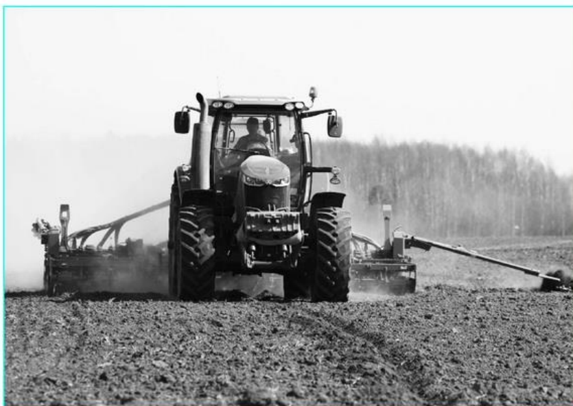
Ауданның ауыл шаруашылығы тауар өндірушілері көктемгі дала жұмыстарын кіріскені бір аптандай уақыт болды. Қазір алқаптарда егін егу жұмысы қызған шақ.

Ауданның ауыл шаруашылығы және ветеринария бөлімінің мәліметінше, 22 мамырда аудан бойынша 435,6 мың гектар аумақта ылғал жабылып, ол жоспар бойынша 100% орындалды. Егін егу алдында 114,3 мың га алан өңделіп, соның ішінде 14,6 мың га алқапқа химиялық өңдеу дер кезінде жасалды. Сондай-ақ 71,4 мың га аумаққа 6800 тонна минералды тыңайтқыштар себілді.