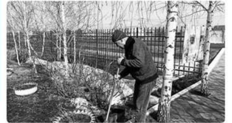
Коллектив центра детского и юношеского творчества «Алтын ұярақ» принял активное участие в субботнике.