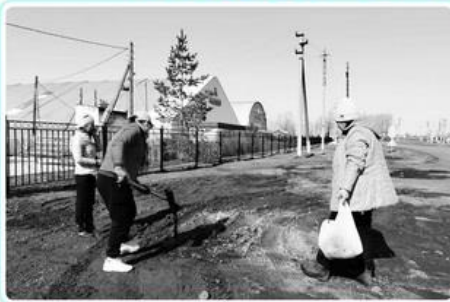
Педагоги и работники средней школы имени Мағжана Жұмабаева поддержали инициативу Президента РК Касым-Жомарта Токаева по проведению экологической акции "Таза Қазақстан" и привели в порядок территорию школы.