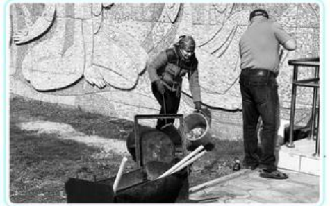
Работники культуры провели уборку прилегающей территории районного Дома культуры.

В с. Надежка сельского округа Ноғайбай би в рамках благоустройства населенных пунктов был проведен субботник.