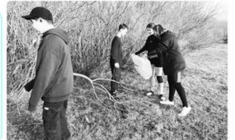
Члены волонтерского клуба "Твори Добро" провели субботник на территории Возвышенской средней школы.