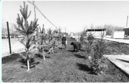
Благоустройство села Каракога.