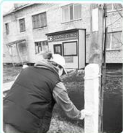
Отдел предпринимательства района Мағжана Жұмабаева на субботнике.