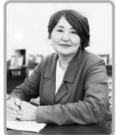
директор Медвежинской средней школы.

С 2015 по 2020 год возглавляла отдел внутренней политики района Магжана Жумабаева, в связи с реорганизацией в 2020–2025 годах - руководителем отдела внутренней политики, культуры и развития языков района Магжана Жумабаева Северо-Казахстанской области.