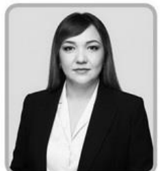
«Центр самодетельного народного творчества и досуговой деятельности» акимата района Магжана Жумабаева Северо-Казахстанской области.

С 2018 по 2026 год работала директором ГККП